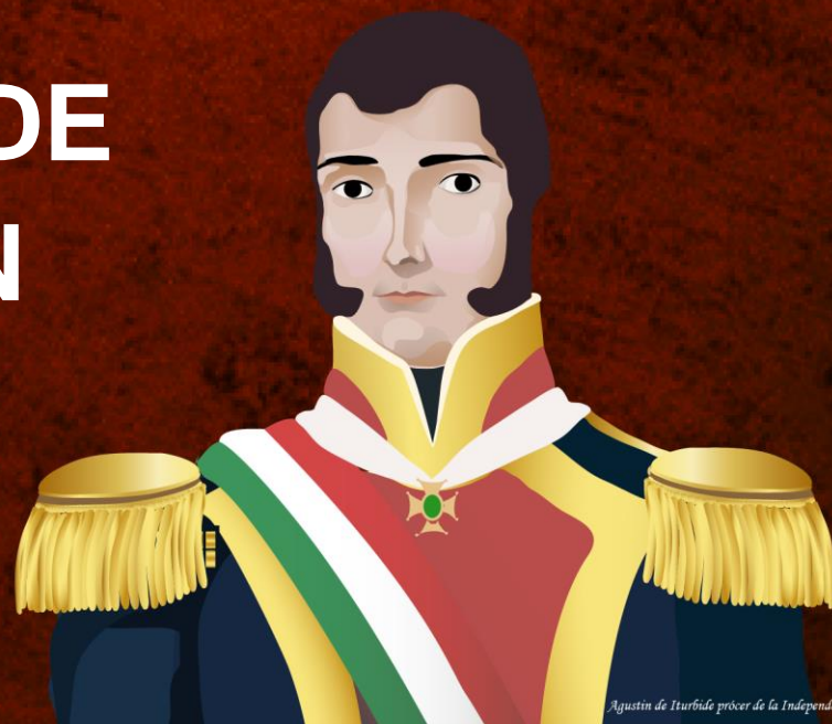
Agustín de Iturbide prócer de la Independencia de México.